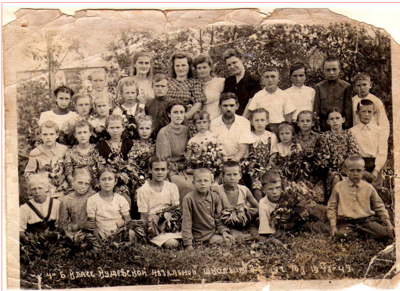
4 «Б» класс Кушевой начальной школы № 16 уч. год 1948-49.

тоже постараемся прожить честно и достойно и приложим все усилия, чтобы наш родной край и район процветали!