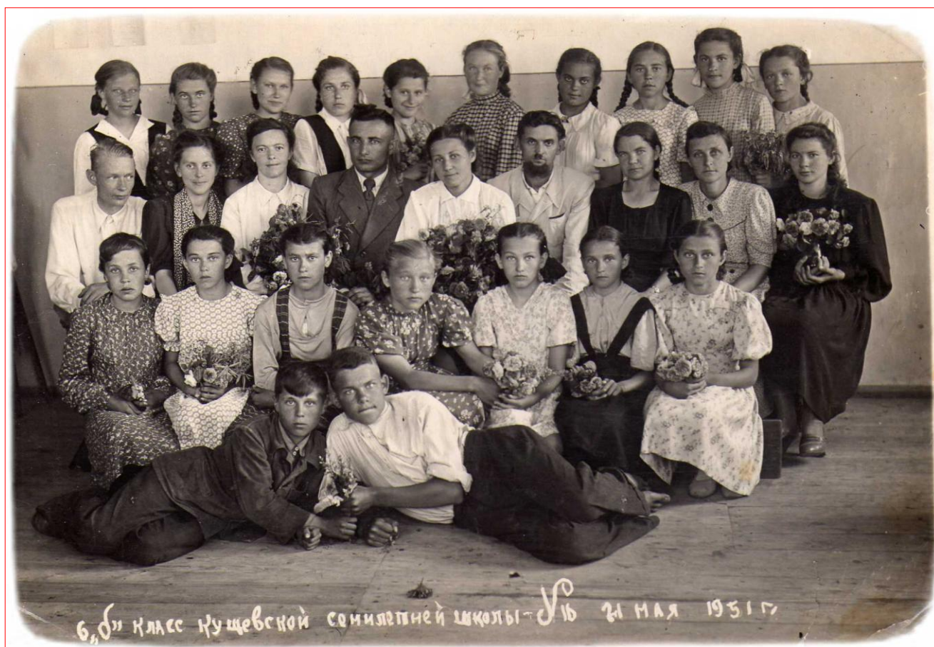
6 «Б» класс Кушевской семилетней школы № 16 21 мая 1951 г.