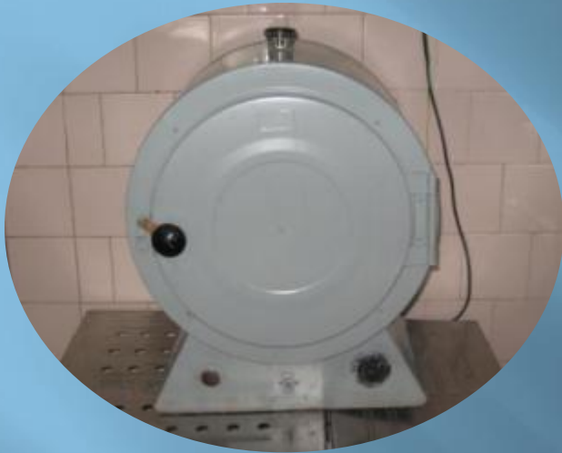
Жарочный шкаф для столовых приборов