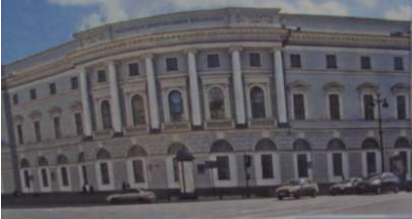
Главная библиотека в Санкт-Петербурге.

Библиотека - это собрание книг, которые один или много людей собрали и хранят. Собрали с любовью и хранят с заботой. В нашей стране первые библиотеки появились много веков назад. В библиотеках так много книг, что среди них трудно найти нужную. И здесь на помощь приходят указатели-каталоги. В длинных шкафах стоят карточки. На каждой карточке написано название книги и фамилия её автора. А в углу - знак. Он состоит из букв и цифр. Этот знак - сокращённый адрес книги на книжной полке.