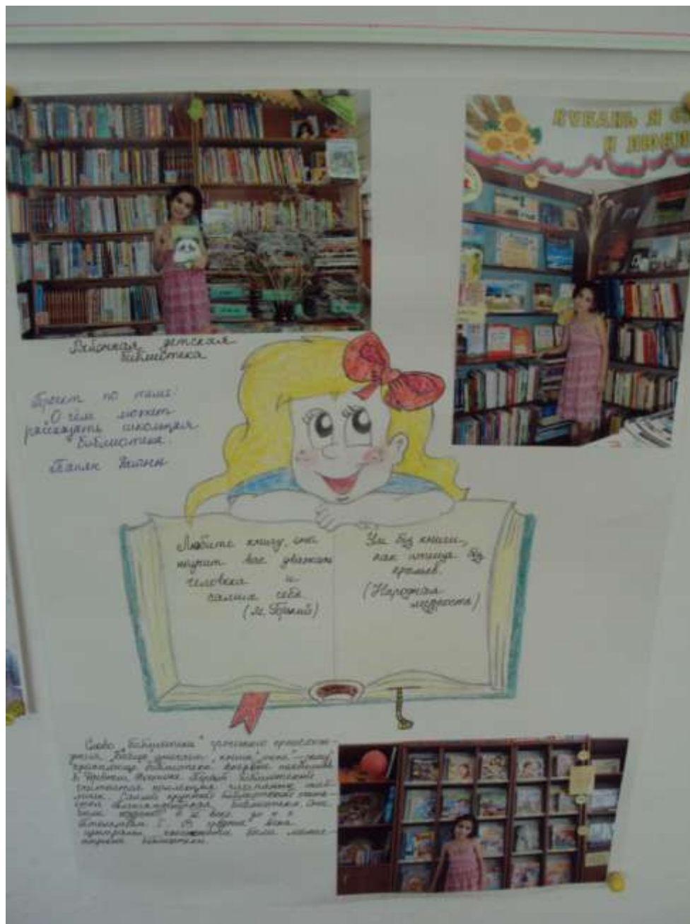
Проект Папян Дианы.