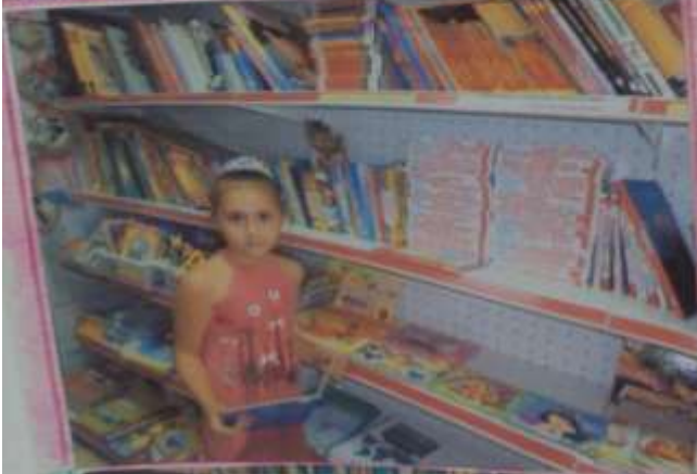
Книжки на полках тоже имеют адрес

Таким образом сразу узнаёт на какой полке искать книгу. Вот и в нашей библиотеке очень много интересной книги. Они расставлены по разным разделам, выставлены по тематическим разделам, такие как край нашей любимой, природа вокруг нас, история нашей страны, техника, детские фантастики, художественная литература, сказки, приключения, фантастика, новинки и др. Так же книги стоят в алфавитном порядке.